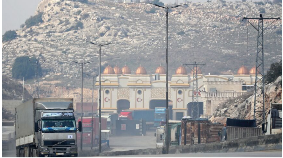
Görsel: Bab El Hava Sınır Kapısından Türkiye'den Suriye'ye geçiş yapan bir insani yardım konvoyu. 18 Ocak 2022

Suriye'nin kuzeybatısındaki insani ihtiyaçlar, yıkıcı depremlerden önce bile akutken; IRC'nin ifadeleriyle kriz, başından itibaren birçok açıdan daha önce hiç bu kadar karmaşık olmamıştır. Bölge nüfusu çatışma nedeniyle geçmişte çok sayıda yerinden edilme yaşamışken şimdi %60'ından fazlası depremlerle yeniden ülke içinde göç etmiş durumdadır. 6