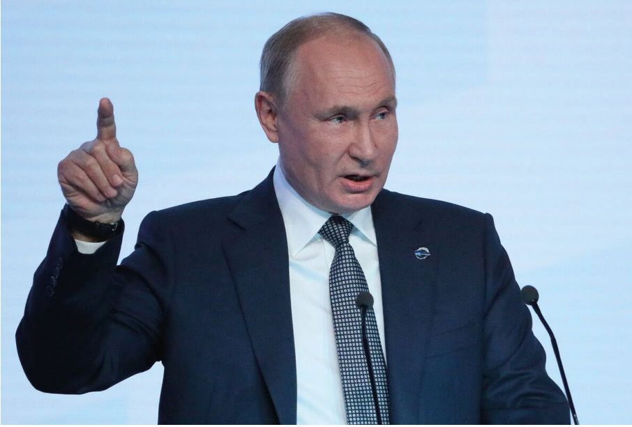
Görsel: Putin Sochi konuşmasında. 21 Ocak 2021

Çin ve Rusya'nın veto tehditleri, yardımların Suriye'ye girişi üzerinde önemli bir etkiye sahiptir. Özellikle 2021 yılında, Bab al-Hawa sınır kapısının süresinin uzatılması için yapılan oylamalarda Çin ve Rusya'nın itirazları nedeniyle belirsizlikler yaşanmıştır. Bu veto tehditleri, BM Güvenlik Konseyi üyeleri arasında ciddi bir bölünmeye neden olmuş ve yardımların Suriye'ye girişi için gerekli olan kararların zamanında alınmasını engellemiştir. Bu durum, Suriye'deki insani krizin derinleşmesine ve milyonlarca insanın gıda, ilaç ve diğer temel ihtiyaçlardan mahrum kalmasına yol açmıştır.