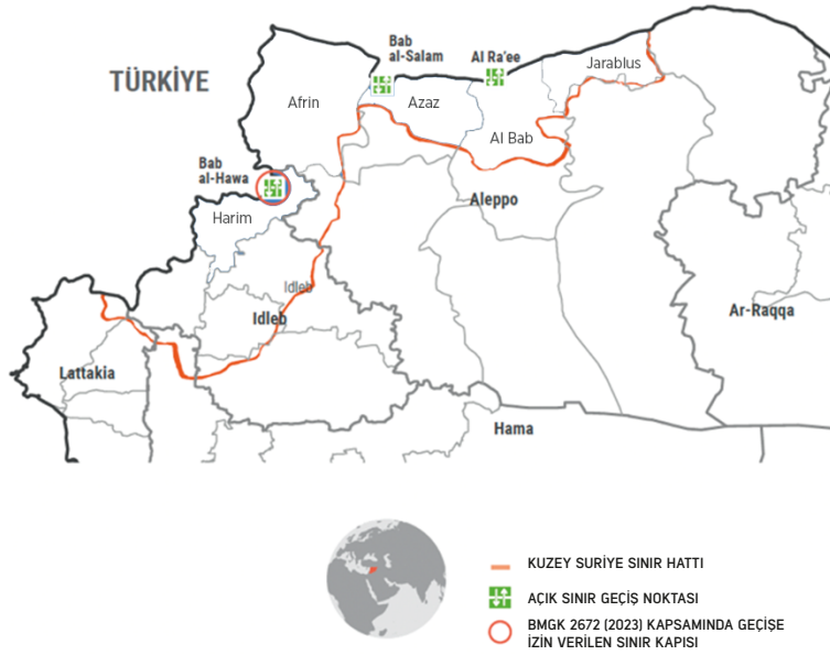
Türkiye'den Suriye'ye Uluslararası Yardım Geçiş Noktaları Temmuz 2023

BM Güvenlik Konseyi, Suriye'deki insani duruma çözüm bulmak adına 2014 yılında 2165 sayılı kararı kabul etmiştir. BMGK, ilk kararın kabulünden itibaren müteakip yıllarda 2191 (2014), 2258 (2015), 2332 (2016), 2393 (2017), 2449 (2018), 2504 (2020), 2533 (2020), 2585 (2021) ve 2672 (2022) sayılı kararlarıyla Suriye'de 10 Temmuz 2023 tarihine kadar insani yardım sağlama konusunda önemli yetkiler vermiştir. 7 Bu kararlar kapsamında BM kuruluşları ve ortakları, ihtiyaç sahibi Suriyelilere insani yardımı sağlamak amacıyla ikisi Türkiye'den Bab al-Salam, Bab al-Hawa olmak üzere; Ürdün'den al-Ramtha ve Irak'tan al-Yarubiyah'daki sınır kapıları üzerinden geçen yolları kullanma yetkisi elde etmiştir.