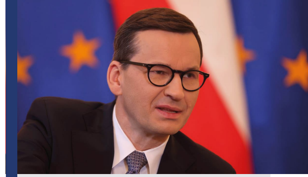
Polonya Başbakanı Morawiecki

kısıtlayan zorlu bir politika konusunda yol gösterecektir" 10 ve "Ben başbakan iken, Macaristan