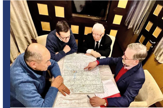
Çek Başbakanı Petr Fiala, Polonya ve Slovenya Başbakanları ile Kiev'i ziyaretinden.

Mültecilere yönelik en sert söylemlere sahip liderlerden olan Macaristan başbakanı Viktor Orban "Onlarla [Ukraynalılar] ilgilenmeye hazırız ve bu zorluğun üstesinden hızlı ve etkili bir