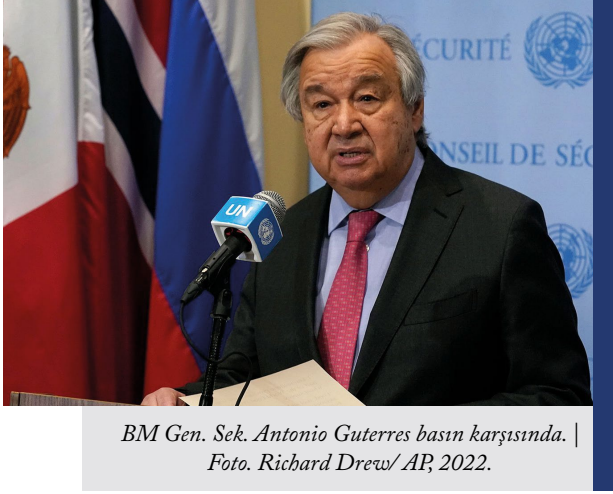
BM Gen. Sek. Antonio Guterres basın karşısında.

BM Mülteciler Yüksek Komiseri (UNHCR) Filippo Grandi de Ukrayna sınırında savaştan kaçan ve Avrupalı olmayan bazı mültecilerin ırkçı uygulamalarla karşı karşıya kaldığını ve bu haberlerin "Rus dezenformasyonu" ya da yalan haberler olmadığını kabul etmiştir. 71