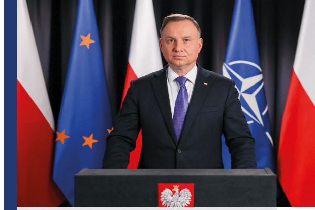
Andrzej Duda basın karşısında.

Polonya Cumhurbaşkanı Andrzej Duda Korcowa’da mültecilerin kabul edildiği bir sınır geçiş tesisini gezmiş ve burada Ukraynalı mülteci-