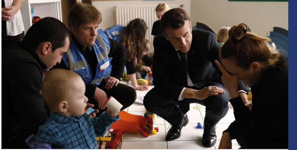
Yoan Valat, Afp. Fransa Cumhurbaşkanı 15 Mart 2022 tarihinde Ukraynalı sığınmacıların bulunduğu kabul merkezini ziyaret ederken.

Fransa Cumhurbaşkanı Emmanuel Macron aynı dönemdeki göç dalgasına ilişkin “Ortak bir sınır gücüne ve bir Avrupa iltica ofisine, sıkı kontrol yükümlülüklerine ve her ülkenin Avrupa İç Güvenlik Konseyi’nin yetkisi altında katkıda bulunacağı bir Avrupa dayanışmasına ihtiyacımız olacak. Göç konusunda hem değerlerini hem de sınırlarını koruyan bir Avrupa’ya inanıyorum” 15 açıklamasıyla Avrupa’nın göçe karşı sınırlarını koruması gerektiğini ifade etmiştir. Macron ayrıca, “Fikir, Libya’da erişim noktaları oluşturmaktır, böylece insanlar iltica için uygun olmadıklarında çılgın riskler almaktan kaçınırlar. Biz onları almaya gideceğiz” 16 şeklindeki açıklamasıyla özellikle Afrika’dan gelen göçleri engellemek amacıyla bu kıtadan gelen insanları Libya’da inşa edilecek merkezlerde toplayıp insanların içlerinden dilediklerini seçerek ülkesine