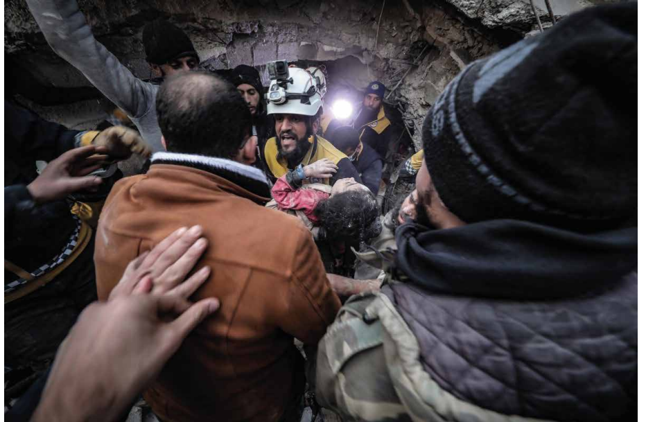
Görsel: Suriye'nin kuzeyinde Beyaz Baretliler enkaz altından bir çocuğu kurtarıırken, @SyriaCivilDef Twitter, 2023

Bölgedeki arama-kurtarma çalışmaları Suriye Sivil Savunma (Beyaz Baretliler) olarak bilinen sivil toplum kuruluşunun öncülüğünde devam etmektedir. Bunun yanı sıra, bölge halkı da arama-kurtarma çalışmalarına destek vermektedir. Ancak, ekipman ve yakıt teminindeki sıkıntılar, profesyonel ekiplerin azlığı ve iş makinelerinin yetersizliği gibi sebeplerle bölgedeki arama-kurtarma faaliyetleri oldukça zor şartlar altında gerçekleştirilmektedir.