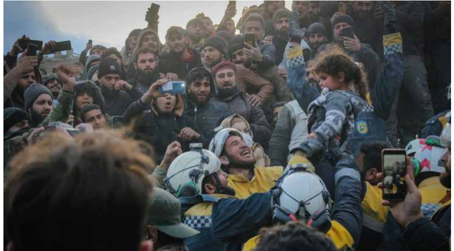
Görsel: Suriye’nin Cinderes şehrinde Beyaz Baretliler enkaz altından iki çocuğu kurtarıırken, @SyriaCivilDef Twitter, 2023.

12 Şubat itibariyle, Kuzeybatı Suriye’de deprem kaynaklı can kaybı 4.400’den fazladır. 8.500’den fazla insan ise yaralı olarak kurtarılmıştır. Deprem sebebiyle çöken binaların altında çok fazla insan olması sebebiyle ölü ve yaralı sayılarında artış beklenmektedir. Şu ana kadar 1.700’den fazla bina tamamen yıkılmış durumdadır. 6.300’den fazla bina ise kısmen hasarlı olarak tespit edilmiştir. Yerel makamlardan alınan bilgilere göre, deprem sebebiyle 11 binden fazla insan evsiz kalmıştır. Depremden doğrudan etkilenerek ev ve barınaklarını kaybeden 280 binden fazla insanın ise acil barınma ihtiyacı bulunmaktadır.