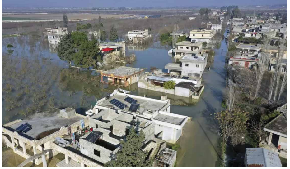
Görsel: 9 Şubat 2023 Perşembe günü Suriye'nin İdlib ili, Türkiye sınırı yakınlarındaki Salqeen kasabasındaki bir nehir barajını tahrip eden yıkıcı bir depremin ardından sular altında kalan al-Tlul köyünün havadan görünümü.

Bölgedeki arama-kurtarma faaliyetleri oldukça zor şartlar altında gerçekleştirilmektedir.