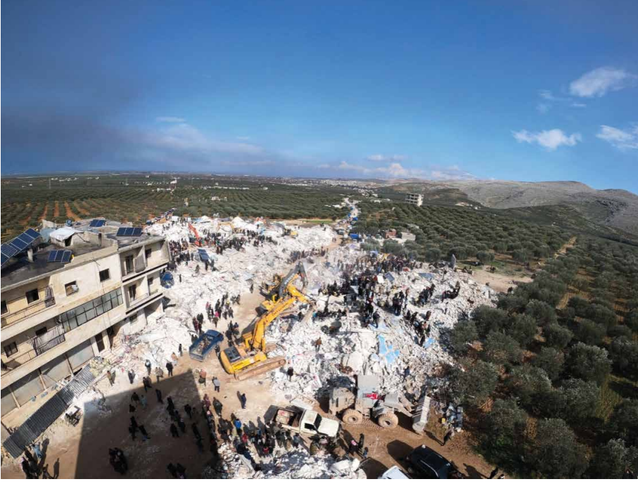
Görsel: Suriye'nin kuzeyinde yıkılan binaların kuşbakışı görüntüsü.