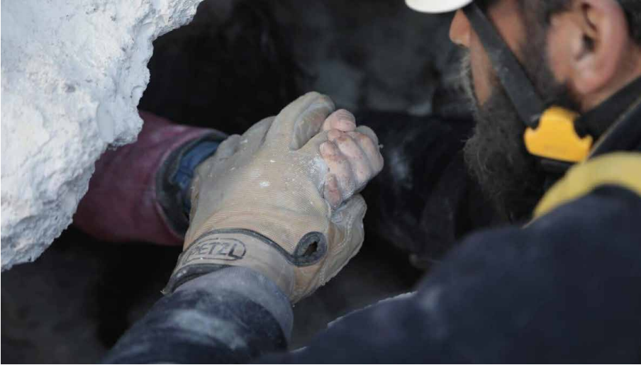
Görsel: Kuzeybatı Suriye'de enkaz çalışmaları bir arama-kurtarma görevlisi.

Kuzeybatı Suriye'ye yönelik insani yardımlar ise yalnızca Türkiye'nin Cilvegözü sınır kapısı aracılığıyla Suriye'nin İdlib bölgesinde yer alan Bab el-Hava sınır kapısından ulaştırılabilmektedir. Ancak, bölgenin mevcut durumu, Türkiye'nin de depremden oldukça etkilenmesi ve uluslararası toplumun ilgisizliği gibi sebeplerle, Kuzeybatı Suriye'ye yönelik yardımlar depremin gerçekleşmesinden 4 gün sonra bölgeye ulaştırılabilmektedir. Türkiye'de faaliyet gösteren ve Kuzeybatı Suriye'de de insani yardım faaliyetleri gerçekleştiren birçok sivil toplum kuruluşu, söz konusu engeller ve durumlar sebebiyle Suriye'ye yeterli desteđi verememektedir. Bu bakımdan, Kuzeybatı Suriye uluslararası toplum tarafından adeta yalnız bırakılmış durumdadır. Birleşmiş Milletler (BM) İnsani İşlerden Sorumlu Genel Sekreter Yardımcısı ve Acil Yardım Koordinatörü Martin Griffiths, Türkiye-Suriye sınırında Suriye Sivil Savunma (Beyaz Baretliler) kurumunun başkanı Raed Al Saleh ile görüşmüş ve hem Türkiye hem de Suriye için yardım çağrısında bulunacağını ifade etmiştir. Görüşmede, eksiklikler ve hatalar için bölge halkından özür dileyen Griffiths'in bu tutumu olumlu bir gelişme olarak görülse de, uluslararası toplumun Kuzeybatı Suriye'ye yönelik acil yardımları bir an önce gerçekleştirmesinin hayati önemini değiştirmemektedir.