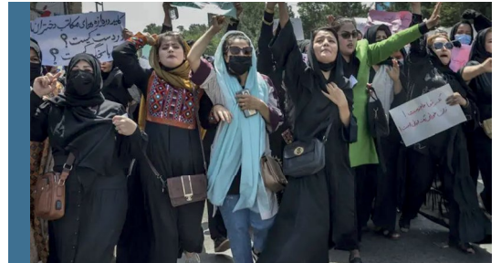
Görsel: Afgan kadınlar, 13 Ağustos 2022 tarihinde, Kabil'in merkezinde ülkedeki bak ihlallerine karşı gösteri yapıyor.

Afganistan'da zaten oldukça zor şartlarda hayatlarını devam ettiren kadınların temel haklarının gün geçtikçe erozyona uğradığı söylenebilir. Eğitimden sağlığa, seyahatten ifade özgürlüğüne ve hatta iş sahibi olmaya kadar neredeyse her alanda kadınlara yönelik kısıtlamalar bulunmaktadır. Söz konusu kısıtlamaların sona erdirilmesi ya da gevşetilmesi için, özellikle on yıllardır Afganistan'da devam eden çatışmalara taraf olan devletlerin ve uluslararası toplumun sorumluluk alarak hukuki, siyasi ve mali yönleriyle Afganistan'ın kalkınmasına katkı sağlamaları gerekmektedir.