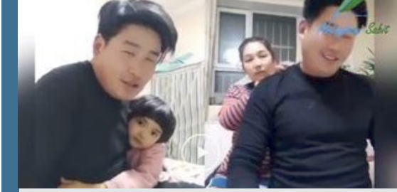
Görsel: Doğu Türkistan'daki Uygur ailelerin evlerine yerleştirilen Han Çinli erkekler, hanelerdeki kadınlara ve çocuklara adeta birer köle gibi davranıyorlar.

ÇKP yönetiminin uygulamaları öylesine insanlık dışı bir boyuta ulaşmıştır ki, toplama kamp- larında tecavüze uğrayan kadınlar, tecavüze uğ- radıkları sırada diğer kadınlar ise bu insanlık dışı eylemleri izlemeye zorlanmaktadırlar.