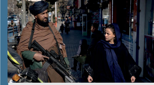
Görsel: Taliban hükümetinin kadınların STK'larda çalışmasına yönelik yasağı, insanların gıda, eğitim, sağlık hizmetleri ve diğer kritik hizmetlerden mahrum kalacağına dair korkuları artırdı.

Ülke genelindeki kadın sivil toplum kuruluşlarının %77'si 2022 yılı itibarıyla tüm fonlarından ve kaynaklarından mahrum olduklarını ve herhangi bir proje yürütmediklerini bildirmişlerdir. Ülkedeki sağlık merkezlerinin %86'sında kadın hemşire bulunmazken, %71'inde ise kadın doktor bulunmamaktadır. Kadınların yalnızca %10'u temel sağlık hizmetlerine erişimlerinin olduğunu ifade etmektedir.