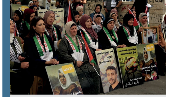
Görsel: İsrail hapisanelerinde tutsak olan yakınları için protesto gösterisi düzenleyen kadınlar.

Gözaltına alınan kadınların aileleri de İsrail makamları tarafından tutuklanmakla tehdit edilmektedir. İsrail hapisanelerinde tutuklu bulunan Filistinlilerin haklarını korumak için çalışan Filistinli Tutsaklar Kulübü (PPC) isimli sivil toplum kuruluşuna göre İsrail, 1967'den bu yana 17 binden fazla Filistinli kadını tutuklamıştır.