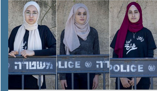
Görsel: Filistinli kadınlar İsrail işgaline karşı direnişe öncülük ediyor.

İsrail tarafından Filistinli kadınlara yönelik gerçekleştirilen bir diğer hak ihlali de keyfi gözaltılar ve tutuklamalardır. 2022 yılının tamamında 125'den fazla Filistinli kadın tutuklanmıştır. 2022 yılındaki verilere göre 32 Filistinli kadın keyfi gözaltılar ve tutuklamalarla İsrail hapisanelerinde tutuklu bulunmaktadır. Kadın mahkumlar İsrail makamları tarafından sık sık fiziksel, cinsel ve psikolojik şiddete ve işkenceye maruz kalmaktadır. Söz konusu şiddet eylemlerine uykudan mahrum bırakma, tecrit, tehdit, taciz ve dayak da dahildir.