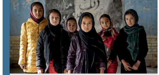
Görsel: Afgan kız öğrenciler Afganistan'ın Kabil kentinde bir sınıfta fotoğraf çekilmek için poz veriyor.

Zira, söz konusu karar yüksek öğrenimlerine devam etmekte olan 100 binden fazla kadını etkilemiştir. Karar sonrasında Afgan kadınlar hem üniversitelerde hem de sokaklarda protesto gösterileri düzenlemiştir. Bu gösterilere zaman zaman erkekler de destek vermiştir. Protesto gösterilerinin bir kısmında Taliban güvenlik güçleri tarafından şiddet kullanıldığı gözlemlenmiştir.