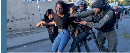
Görsel: Ülkedeki çatışmalar sebebiyle yerinden edilmiş bir kadının Kabül'deki bir parkta tansiyonunu ölçtürüyor.

İşgal atındaki Filistin topraklarındaki kadınlar ve kız çocukları Filistin toplumunda yaygın geleneksel kültürel normlar sebebiyle maruz kaldıkları birtakım ayrımcılıkların yanı sıra onlarca yıllık İsrail işgali ve çatışmalar sebebiyle de yaygın fiziksel, cinsel ve psikolojik şiddete maruz kalmaktadır. Geleneksel yapıdan kaynaklanan hak ihlallerine, zorla evlilik, aile içi şiddet ve miras vb. konularındaki ayrımcılık durumları örnek olarak gösterilebilir. Bunun yanı sıra, İsrail işgal güçlerinin fiziksel şiddet eylemlerine, tacizlerine ve psikolojik şiddete varan uygulamalarına maruz kalmaktadırlar. Yasadışı Yahudi yerleşimleri de Filistinli kadınları ve kız çocuklarının güvenliklerini tehdit etmektedir. Batı Şeria'daki ailelerin %31'i kızlarının güvenliğinden endişe ettiklerini ifade etmektedir.