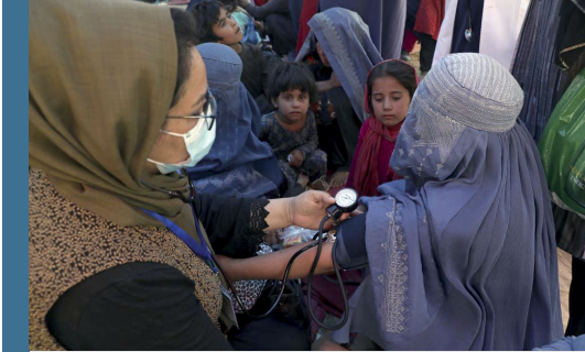
Görsel: Ülkedeki çatışmalar sebebiyle yerinden edilmiş bir kadının Kabil'deki bir parkta tansiyonunu ölçtürüyor.

Ülke genelindeki kadın sivil toplum kuruluşlarının %77'si 2022 yılı itibarıyla tüm fonlarından ve kaynaklarından mahrum olduklarını ve herhangi bir proje yürütmediklerini bildirmişlerdir. Ülkedeki sağlık merkezlerinin %86'sında kadın hemşire bulunmazken, %71'inde ise kadın doktor bulunmamaktadır. Kadınların yalnızca %10'u temel sağlık hizmetlerine erişimlerinin olduğunu ifade etmektedir.