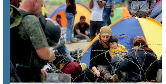
Görsel: Krizlere yönelik tepkiler ve politikalarda kadınlar ve kız çocuklarına yönelik ihlaller ve ihtiyaçlar çoğunlukla göz ardı edilmektedir.

Dünya üzerinde devam eden çatışmalar ve iklim değişikliğinin sebep olduğu krizler de kadınlara yönelik hak ihlallerinin artmasının sebepleri olarak görülmektedir. Bu durumların şiddet olayları ile doğrudan bağlantılı oldukları göz önüne alındığında, kadına yönelik şiddetin artması, artan göç hareketlerinin getirdiği zorluklar, eğitim ve sağlık hizmetlerinden mahrum kalma, cinsel sömürü ve kaçakçılığa maruz kalma gibi birçok zorluk dünya üzerinde kadınların her geçen gün daha fazla hak ihlaline maruz kalmalarına neden olmaktadır.