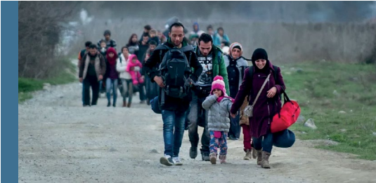
Görsel: Suriye ve Irak'tan gelen göçmenler ve mülteciler Yunanistan-Makedonya sınırındaki Gevegiya kasabası yakınlarında geçiyor.

Ayrıca kamplardaki sağlıksız ortam ve kamp içinde bulaşıcı hastalık riskinin artması, göçmen kadın ve çocukların yaşam hakkını dahi tehdit edebilmektedir. Eğitim kadınların kendilerini ve çocuklarını inşa edebileceği en önemli dayanaklardan biriyken, göç yolunda eğitim olanaklarından uzak geçen süreç, hem kadınların kişisel gelişimini engellemekte hem de gelecek nesilleri dezavantajlı bir duruma sürükleyebilmektedir.