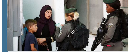
Görsel: İsrail askerleri, işgal altındaki Batı Şeria'daki bir kontrol noktasında Filistinli bir kadın ve çocuğu kontrol ediyor.

Bu durum, eşlerinden ya da ailelerinden gördükleri şiddet eylemlerini bildirmemelerine de neden olabilmektedir. Maruz kaldıkları şiddet olaylarını bildirmeyen kadınların oranının %61 olduğu açıklanmıştır.