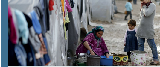
Görsel: Mülteci kamplarındaki kadınlar oldukça kısıtlı imkanlara sahip şekilde bayatlarını devam ettirmeye çalışıyor.

Göçmen kadınlar geceleri kamptaki çadırlardan istismar ve cinsel şiddet riski nedeniyle çıkamamaktadır