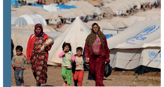
Görsel: Suriye'nin İdlib bölgesinde yer alan Atme kampında yürüyen kadınlar.

Suriyeli kadınlar ve kız çocuklarıyla benzer birçok problemle mücadele eden Güney Sudanlı kadınlar da sık sık olağanüstü zorluklarla karşı karşıya kalmaktadırlar. Güney Sudan, fiziksel şiddetin yanı sıra cinsel şiddet oranlarının da dünyada en yüksek oranda görüldüğü ülkelerden biridir. Eğitim ve iş olanakları ise kadınlar için yok denecek kadar azdır. Zorla yerinden edilmiş 4 milyondan fazla Güney Sudanlı'nın çoğunluğunu da kadınlar ve kız çocukları oluşturmaktadır. 20-24 yaş arası kadınların %51,5'inin 18 yaşından önce evlendikleri belirtilmektedir.