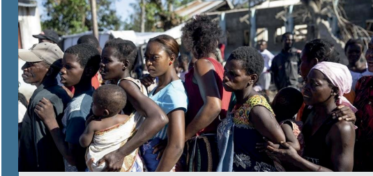
Görsel: Güney Sudan'daki şiddet eylemlerinden en çok etkilenen kadınlar ve çocuklardır.

Ülkede tahminen 475 bin kadın ve kız çocuğu şiddet riski altındadır. Ayrıca, 15-24 yaş arası kadınların yarısından fazlası toplumsal cinsiyete dayalı şiddete maruz kalmışlardır.