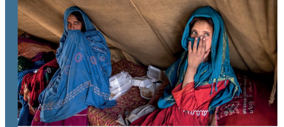
Görsel: Birçok Afgan kadın temel insani yardıma muhtaç.

çelerle engellenmesi bu kısıtlamalardan yalnızca biridir. Hükümet yetkilileri bu durumun geçici olduğunu ve okulların fiziki durumlarının iyi- leştirilmesinin ve yeni bir müfredatın hazırlan- masının ardından kadınların ve kız çocuklarının eğitimlerine devam edeceklerini bildirmiştir. Ancak, 2022 yılının mart ayında yeniden açılan okullar saatler sonra çıkarılan bir kararla tekrar kadın ve kız çocuklarına kapılarını kapatmıştır. Kadınların sivil toplum kuruluşlarında çalış- malarının yasaklanması ve yanlarında bir erkek olmaksızın dışarıya çıkmalarına yönelik kısıtla- malar ise diğer hak ihlalleri arasında sayılabilmektedir. Taliban hükümetinin bu uygulamaları sebebiyle uluslararası yardım kuruluşlarının ve ülkelerin Afganistan'a yönelik yardım faaliyetle- rini askıya almaları ise ülkedeki insani krizi daha da derinleştirmektedir.