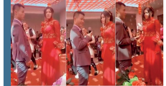
Görsel: Han Çinli erkeklerle zorla evlendirilen bir Uygur kadının söz konusu evlilikten ne kadar rahatsız olduğu yüzünden dabi anlaşılabilir.

Her türlü mahremiyet koşulundan yoksun bırakılan kadınlar Çinli erkeklerle aynı odada ve hatta aynı yatakta yatmaya mecbur bırakılmaktadırlar. Birçoğunun kocası toplama kamplarında esir tutulan ya da zorla çalıştırılmak üzere Çin'in değişik bölgelerine gönderilmiş olan kadınlar bu Çinli erkeklerle aynı evde yaşamaya mahkumlardır. Bu durum sebebiyle birçok taciz ve tecavüz vakasının meydana geldiği bilinmektedir. Kadınlar, bu insanlık dışı uygulamalara karşı gelmeleri durumunda kendilerine ve sevdiklerine dayatılan korkunç işkence ve cezalarla karşı karşıya kalacaklarını bildikleri için adeta bu zulme boyun eğmek zorunda kalmaktadırlar. Söz konusu uygulamaya tabi olan Han Çinli erkekler tarafından, ÇKP hükümetince yerleştirildikleri Uygur evlerinde çektikleri birçok video ise sosyal medya platformlarında paylaşılmaktadır.