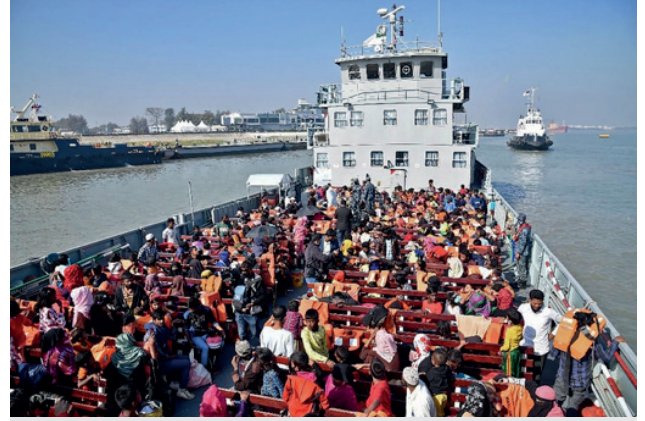
Görsel 2: Bhasan Char Adası'na taşınan Arakanlı göçmenlerden bazıları.

Bangladeş yönetiminin göçmenleri adaya taşıma da en büyük handikaplarından birisi Cox's Bazar yerleşiminden daha iyi barınma koşulları olduğunu öne sürerek "cazip" önerilerle çağrı yaptığı göçmenlere ilişkin adadan bir geri dönüş prosedürüne sahip olmamasıdır. Göçmenler her ne kadar ilk aşamada "gönüllü" olarak adaya gitmiş olsalar da adadaki yetersiz koşullar nedeniyle geri dönmek istediklerinde nasıl bir yöntem