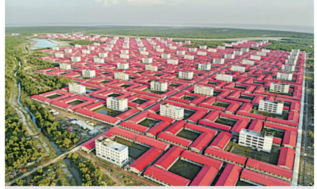
Görsel 1: Bhasan Char'ın havadan görünümü. Yetkililer riskli koşullar göz ardı ederek yerleşimin Roginyalılara ev sahipliği yapmaya hazır olduğunu söylüyor.

Bangladeş'teki Dakka yönetimi Arakanlı Müslümanların Bhasan Char Adası'na yerleştirme planını Aralık 2020'de devreye sokmuştur. Bangladeş yönetiminin hedefi Bangladeş'in Cox's Bazar yerleşimlerinde yaşayan yaklaşık 1.1 milyon Arakanlı göçmenin 12 bir kısmını 20 yıl önce jeomorfolojik bir olay sonucunda Bengal Körfezi'nde yükselmiş bir adaya nakletmektir.