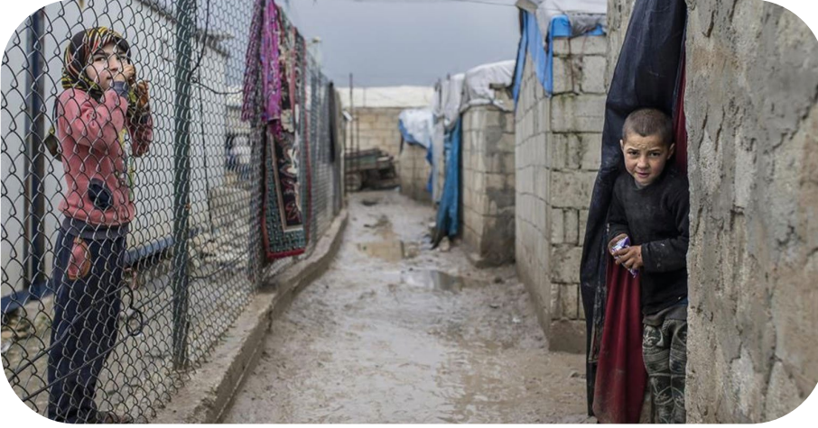
Foto 1: Babüsselam kampında çocuklar. 2018.

Türkiye’nin Kilis sınırında bulunan Öncüpınar kapısından ayrıldıktan sonra sizi Babüsselam çadır kenti karşılıyor. Babüsselam’a ilk gelişler Suriye’deki iç savaşın başladığı ilk yıllara, 2012’ye dayanıyor. Babüsselam’dakilerin yaklaşık 10 yıldır sınır hattındaki Türkiye’den gelen yardımlarla kendi inşa ettikleri briket evlerde [Bu evler daha önce çadırdı.] hayatlarını sürdürmeye çalıştığı görülüyor.