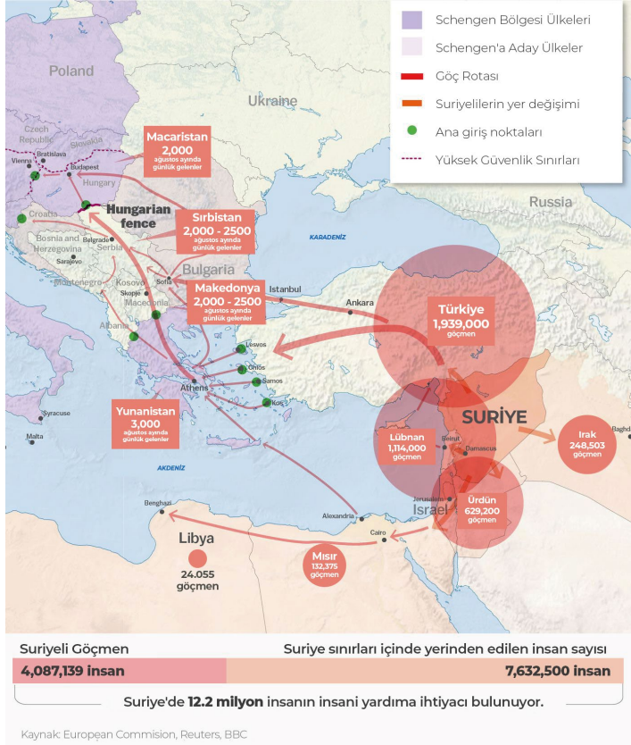
Harita 1: Suriye Göç hareketleri: 2011-2015.

Suriye'deki istikrarsızlık ve otorite boşluğu yabancı savaşçıların Suriye'ye akın etmesine neden olurken, bölgede hazırda bulunan askeri gruplarla beraber kısa sürede çok taraflı çatışmalar baş gösterdi. Öyle ki 2015 yılında Suriye'de 16 farklı silahlı örgütün birbiriyle savaştığı, bu grupların sürekli olarak hakimiyet bölgelerinin değiştiği kayda geçilmekteydi. 1 Askeri çatışmalardan en çok zarar gören kesim öncelikle kadın ve çocuklar olmak üzere sivil halk olmuştur. Bu durum maalesef bugün de değişmedi.