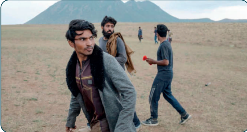
9 Ağustos 2021, Movs World

1989'da Sovyetler'in geri çekilmesi ile Pakistan'dan gelerek silahlı isyan başlatan "mücahit" gruplar ve aşiretler arasındaki güç paylaşımı konusundaki anlaşmazlıklar bir iç savaşı meydana gelmiş; 1993-1994'te yeniden yükselen ülke içinde yerinden edilmeler, 1996'da Taliban iktidara gelene kadar devam etmiştir (Schmeild, 2019: 11-12). Bu dönemde Taliban'ın iktidarda olduğu ilk yıllar içinde yeni bir göç akışı yaşanmamıştır. Ele geçirilen bölgelerde bir miktar barış ve istikrar sağlanmasına karşın ilerleyen zamanlardaki katı uygulamaları ve kadınların eğitimi, sosyal ve kültürel yaşamları üzerindeki kısıtlamaları halkın bir kısmını, özellikle eğitilmiş kesimini göçe sevk etmiştir (Margesson, 2007: 3). 2000 yılında son otuz yılın en kötü kuraklığının Afganistan'ı vurmasıyla birlikte de ülke içinde yerinden edilmeler derinleşmiştir.