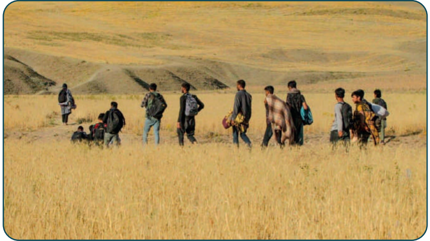
Türkiye-İran sınırındaki Afgan göçmenler, 27 Temmuz 2021

ABD'nin geri çekilmesi ve ardından Taliban'ın yönetimi ele almasıyla birlikte yeni bir göç dalgası gelecek mi sorusu gündemdeki sıcaklığını korumaktadır. Yıllardır süregelen göç akınının arkasında ekonomik ve çevresel faktörlerin yanı sıra, ABD işgalinin ve savaş suçlarının getirdiği yıkımın yattığı da gözlemlenmektedir. Ülkede toplumun haklarını garanti edecek, istihdam koşullarını geliştirecek ve sürdürülebilir sosyal yardım mekanizması izleyecek bir devlet yapısının olmaması, toplumu güvensiz hissettirmektedir.